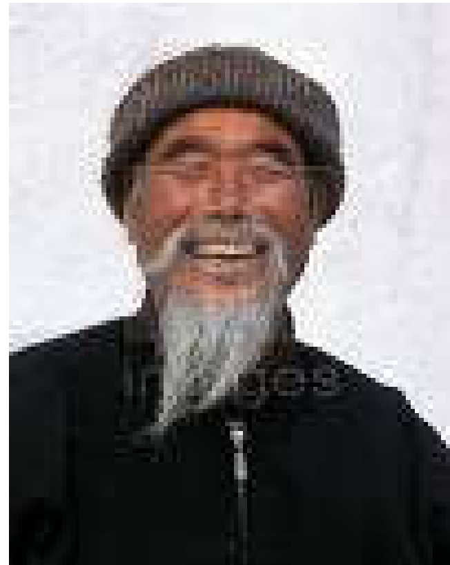
Jan Peter Balkenende