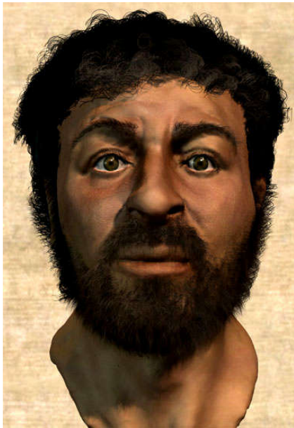
Jezus volgens de wetenschap: de Palestijn